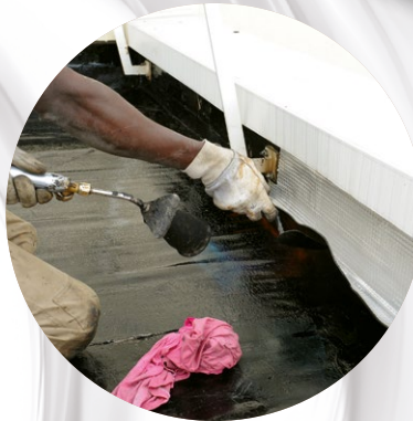
ENTRETIEN ET TRAVAUX D'ÉTANCHÉITÉ